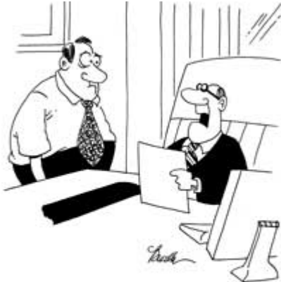
"I just wanted to let you know, Wilson, that I'll be blaming you for everything until the computers are back up."