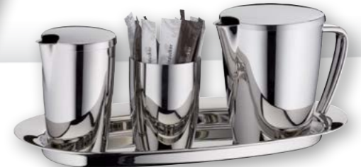
Beispiel / Example: Teekanne 0,35 Liter / Tea pot 12,3 oz. Zuckerbehälter / Sugar bowl Milch- und Sahnebehälter / milk jug Deckel für Zucker-/Sahnebehälter / lid for milk jug/sugar bowl Serviertablett „S“ / serving tray "S"