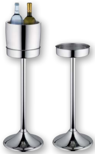
Ständer für Champagner-Kühler, Edelstahl 18/10 Stand for champagne cooler, stainless steel 18/10 57.0114.6040 Ø 200 mm, Höhe 600 mm, Ø 7 14/16 in., height 23 10/16 in.