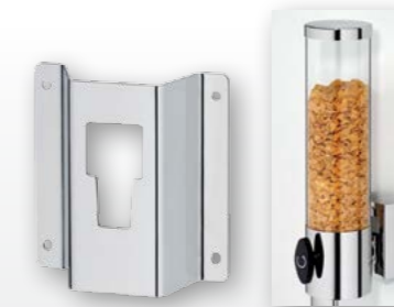
Wandhalterung, einfach, Edelstahl 18/10 Wall mount, single, stainless steel 18/10 57.0125.6040 Einfache Montage an der Wand, für eine Dispenser-Röhre, inkl. Schrauben und Dübel. Easy to fix at the wall, for 1 dispenser pipe, incl. screws and screw anchors. Maße: 125 x 132 x 39 mm Size: 5 x 5 1/4 x 1 1/2 in.