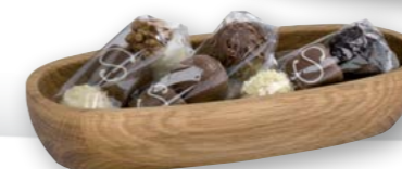
Beispiel Pralines Example pralines Holzschale „S“ Wood dish "S"

57.0095.6040 „S“ Länge 246 mm, Breite 118 mm, Höhe 20 mm length 9 11/16 in., width 4 5/8 in., height 13/16 in.