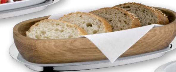
Beispiel Brot Example bread

Servier- und Menagentablett „S“, Edelstahl 18/10 Serving tray "S", stainless steel 18/10