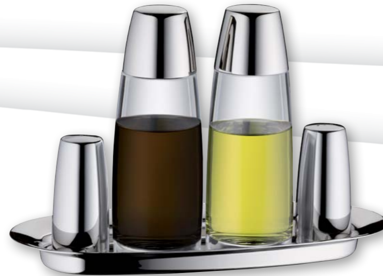
Menage, bestehend aus: Cruet stand, consisting of:

57.0100.6040 Ø 37 mm, Höhe 80 mm Ø 1 7/16 in., height 3 1/8 in.