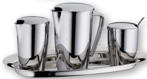
Beispiel / Example: Kaffeekanne 0,3 Liter / Coffee pot 10,6 oz. Zuckerbehälter / Sugar bowl Milch- und Sahnebehälter / milk jug Deckel für Zucker-/Sahnebehälter / lid for milk jug/sugar bowl Serviertablett „S“ / serving tray "S"