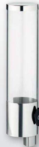
Behälter für Cerealiendispenser Container for cereal dispensers 57.0127.6040 Inhalt 3,5 Liter, cap. 123,2 oz. Ø 115 mm, Höhe 500 mm Ø 4 5/16 in., height 19 11/16 in.