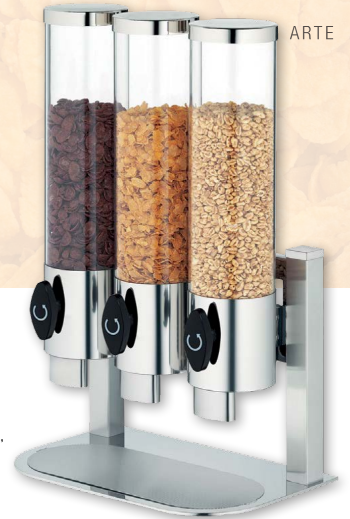
Cerealiendispenser ARTE, Reihenlösung mit 3 Behältern, Edelstahl 18/10 Cereal dispenser EXCELLENT, in-line with 3 containers, stainless steel 18/10 57.0124.6040 Maße: 390 x 250 x 597 mm. Size: 15 1/2 in. x 9 1/4 in. x 23 1/2 in.