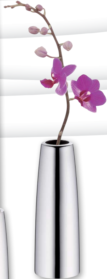
Vase, Edelstahl 18/10 Vase, stainless steel 18/10 57.0101.6040 Ø 46 mm, Höhe 130 mm Ø 1 13/16 in., height 5 1/8 in.

Ein Highlight von VISION ist der doppelwandige Champagnerkühler. Er ist niedriger als die gängigen Modelle und fasst bis zu zwei normale Flaschen oder eine Flasche in Magnum-Größe – diese hält er auch ohne Eis auf Temperatur. The insulated champagne cooler is one of the VISION highlights. It is deeper than standard models and holds up to two normal bottles, or one magnum – maintaining the temperature without the need for ice.