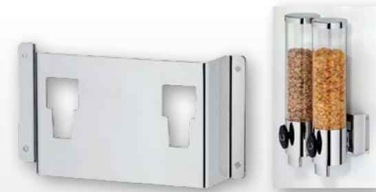
Wandhalterung, doppelt, Edelstahl 18/10 Wall mount, double, stainless steel 18/10 57.0126.6040 Einfache Montage an der Wand, für zwei Dispenser-Röhren, inkl. Schrauben und Dübel. Easy to fix at the wall, for 2 dispenser pipes, incl. screws and screw anchors. Maße: 250 x 132 x 39 mm Size: 9 3/4 x 5 1/4 x 1 1/2 in.