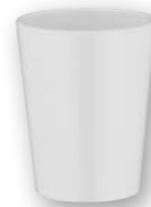
Becher, Porzellan Cup, porcelain 57.0080.9800 Höhe 72 mm, Ø 58 mm. height 2 13/16 in., Ø 2 5/16 in.