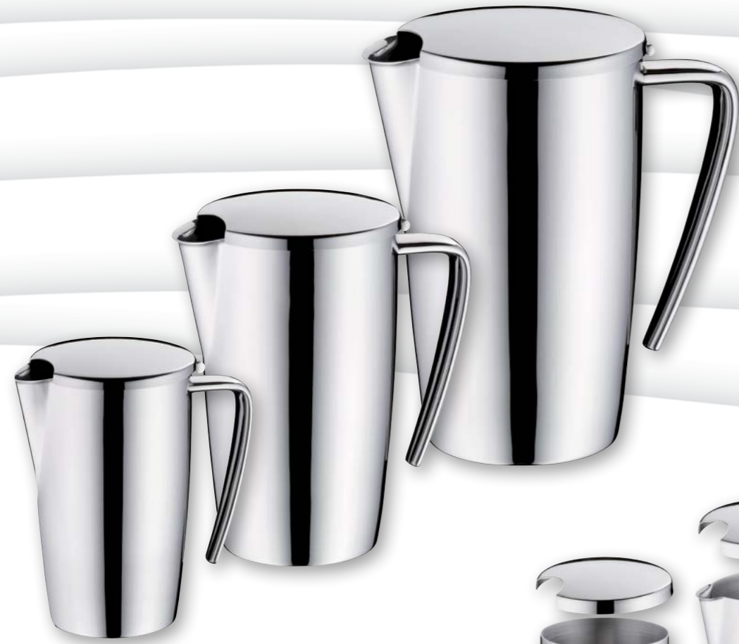
Kaffeekanne, Edelstahl 18/10 Coffee pot, stainless steel 18/10 57.0089.6040 1,2 Liter Ø 110 mm, Höhe 189 mm 42,2 oz. Ø 4 5/16 in., height 7 7/16 in. 57.0088.6040 0,6 Liter Ø 89 mm, Höhe 155 mm 21,1 oz. Ø 3 1/2 in., height 6 1/8 in. 57.0087.6040 0,3 Liter Ø 72 mm, Höhe 124 mm 10,6 oz. Ø 2 13/16 in., height 4 7/8 in.