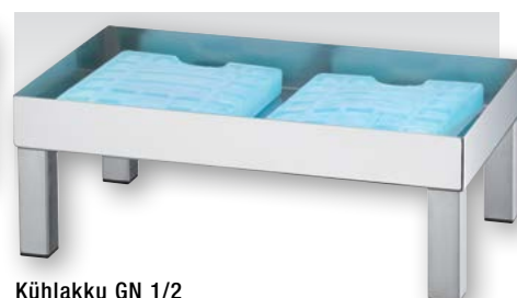
Kühllakku GN 1/2 Ice pack GN 1/2

Länge 510 mm, Breite 300 mm, Höhe 185 mm Length 20 1/16 in., Breite 11 13/16 in., Höhe 7 5/16 in.