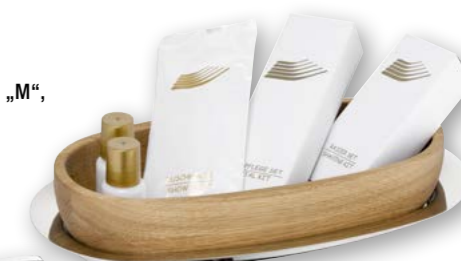
Beispiel Hygieneartikel Example sanitary articles

Servier- und Menagentablett „M“, Edelstahl 18/10 Serving tray "M", stainless steel 18/10