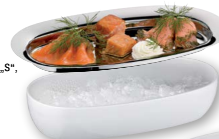
Beispiel „Kühler“ Example „cooler“

Servier- und Menagentablett „S“, Edelstahl 18/10 Serving tray "S", stainless steel 18/10