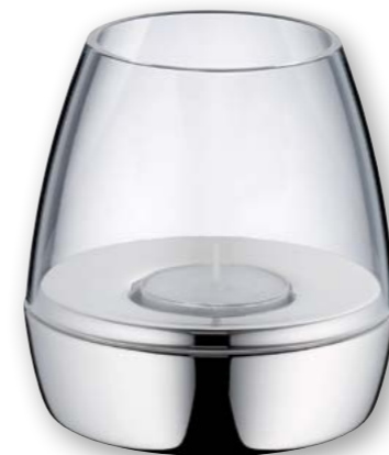
Windlicht, Glas und Edelstahl 18/10 Candle lamp, glass and stainless steel 18/10 57.0097.6040 Ø 99 mm, Höhe 101 mm Ø 3 7/8 in., height 4 in.