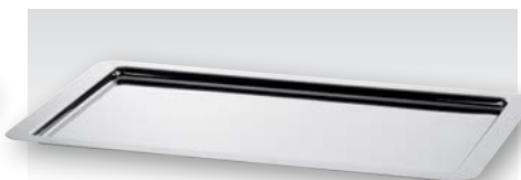
Servierplatte, Edelstahl 18/10, GN 1/1 Serving plate, stainless steel 18/10, GN 1/1

Länge 530 mm, Breite 325 mm, Höhe 20 mm Length 20 1/16 in., Breite 12 13/16 in., Höhe 13/16 in.