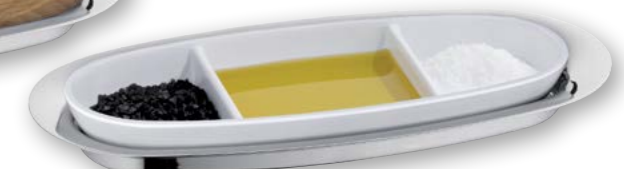
Beispiel Öl und Salz Example oil and salt

Servier- und Menagentablett „S“, Edelstahl 18/10 Serving tray "S", stainless steel 18/10