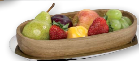
Beispiel Obst Example fruit

Menüöffel TALIA, Edelstahl 18/10 Table spoon TALIA, stainless steel 18/10