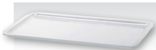
Servierplatte, Porzellan, GN 1/1 Serving plate, porcelain, GN 1/1