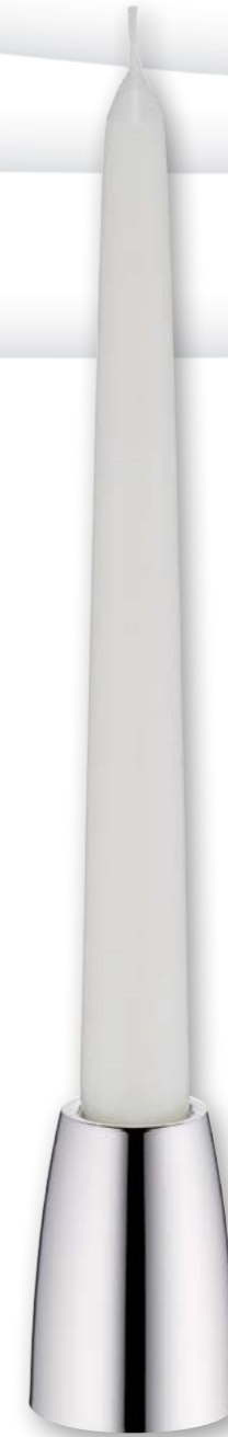
Kerzenleuchter klein, Edelstahl 18/10 Candle holder small, stainless steel 18/10 57.0103.6040 Ø 46 mm, Höhe 66 mm Ø 1 13/16 in., height 2 5/8 in.