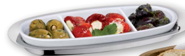
Beispiel Antipasto Example Antipasto

Porzellanschale „S“ mit 3-Teilung Porcelain dish "S" with 3 divisions