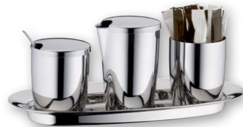
Beispiel / Example: Zuckerbehälter / Sugar bowl Milch- und Sahnebehälter / milk jug Deckel für Zucker-/Sahnebehälter / lid for milk jug/sugar bowl Serviertablett „S“ / serving tray "S"