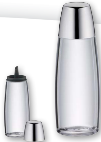
Essig-/Ölflasche, Glas und Edelstahl 18/10 Vinegar & oil bottle, glass and stainless steel 18/10