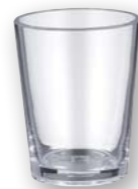
Becher, Glas Cup, glass 57.0081.9990 Höhe 72 mm, Ø 58 mm. height 2 13/16 in., Ø 2 5/16 in.