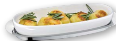
Beispiel Beilagen Example side dish