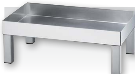
Plattenständer hoch, Edelstahl 18/10 Tray stand high, stainless steel 18/10

Länge 510 mm, Breite 300 mm, Höhe 125 mm Length 20 1/16 in., Breite 11 13/16 in., Höhe 4 15/16 in.