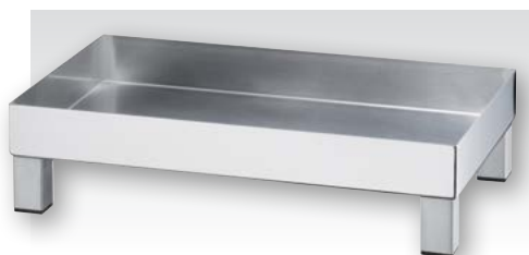
Plattenständer tief, Edelstahl 18/10 Tray stand low, stainless steel 18/10