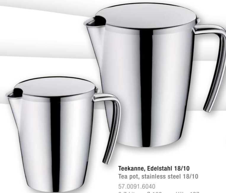
Teekanne, Edelstahl 18/10 Tea pot, stainless steel 18/10 57.0091.6040 0,7 Liter Ø 106 mm, Höhe 137 mm 24,6 oz. Ø 4 3/16 in., height 5 3/8 in. 57.0090.6040 0,35 Liter Ø 85 mm, Höhe 110 mm 12,3 oz. Ø 3 3/8 in., height 4 5/16 in.