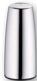
Pfefferstreuer, Edelstahl 18/10 Pepper shaker, stainless steel 18/10

57.0099.6040 Ø 37 mm, Höhe 80 mm Ø 1 7/16 in., height 3 1/8 in.