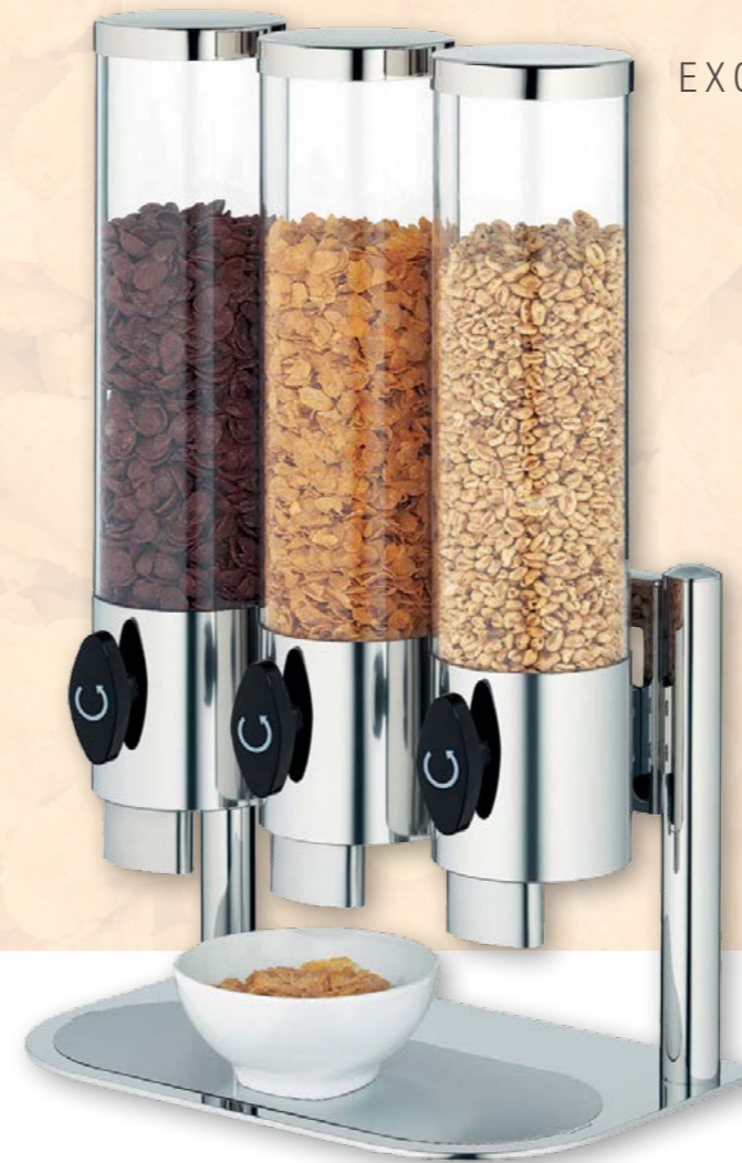
Cerealiendispenser EXCELLENT, Reihenlösung mit 3 Behältern, Edelstahl 18/10 Cereal dispenser EXCELLENT, in-line with 3 containers, stainless steel 18/10 57.0123.6040 Maße: 390 x 250 x 597 mm. Size: 15 1/4 in. x 9 3/4 in. x 23 1/2 in.