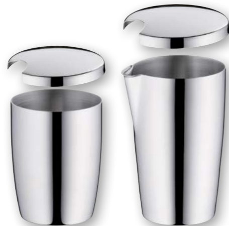
Deckel, Edelstahl 18/10 Lid, stainless steel 18/10 57.0094.6040 Ø 61 mm, Höhe 10 mm Ø 2 5/16 in., height 5/8 in.