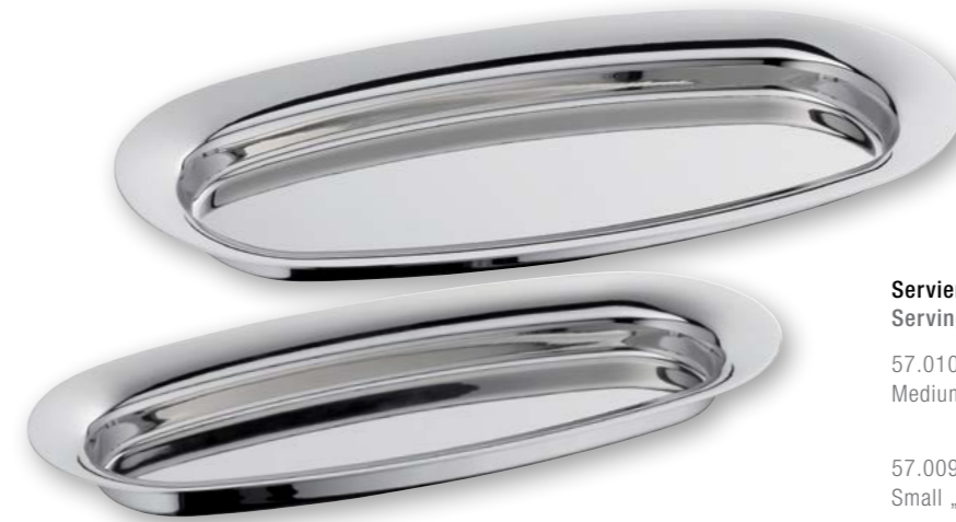
Servier- und Menagentablett, Edelstahl 18/10 Serving tray, stainless steel 18/10 57.0109.6040 Medium „M“ Länge 279 mm, Breite 152 mm, Höhe 20 mm length 11 in., width 6 in., height 13/16 in. 57.0095.6040 Small „S“ Länge 246 mm, Breite 118 mm, Höhe 20 mm length 9 11/16 in., width 4 5/8 in., height 13/16 in.

Setzen Sie mit dieser Kollektion glänzende Akzente in Ihrem Haus