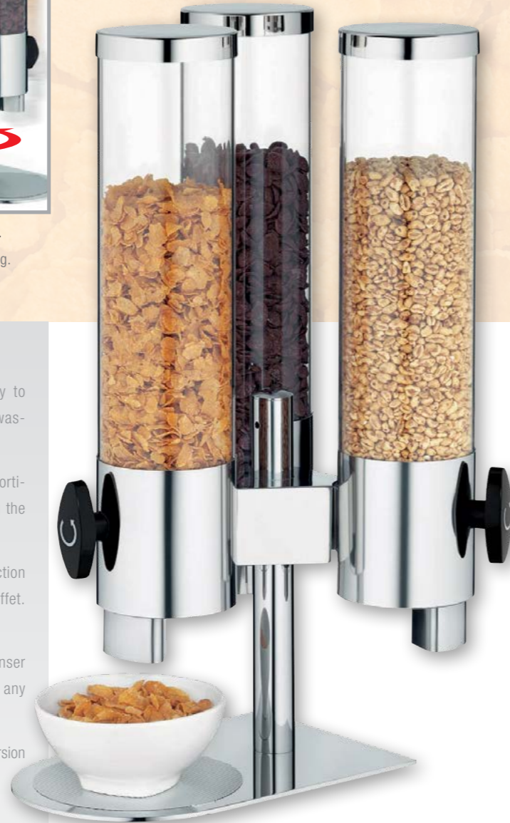
Cerealiendispenser EXCELLENT, drehbar mit 3 Behältern, Edelstahl 18/10 Cereal dispenser EXCELLENT, rotatable with 3 containers, stainless steel 18/10 57.0122.6040 Höhe 597 mm, Ø 35,7 mm. height 23 1/2 in., Ø 1.4 in.