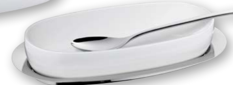
Beispiel als Schale für Vorlagebesteck Example dish for serving cutlery

Servier- und Menagentablett „M“, Edelstahl 18/10 Serving tray "M", stainless steel 18/10