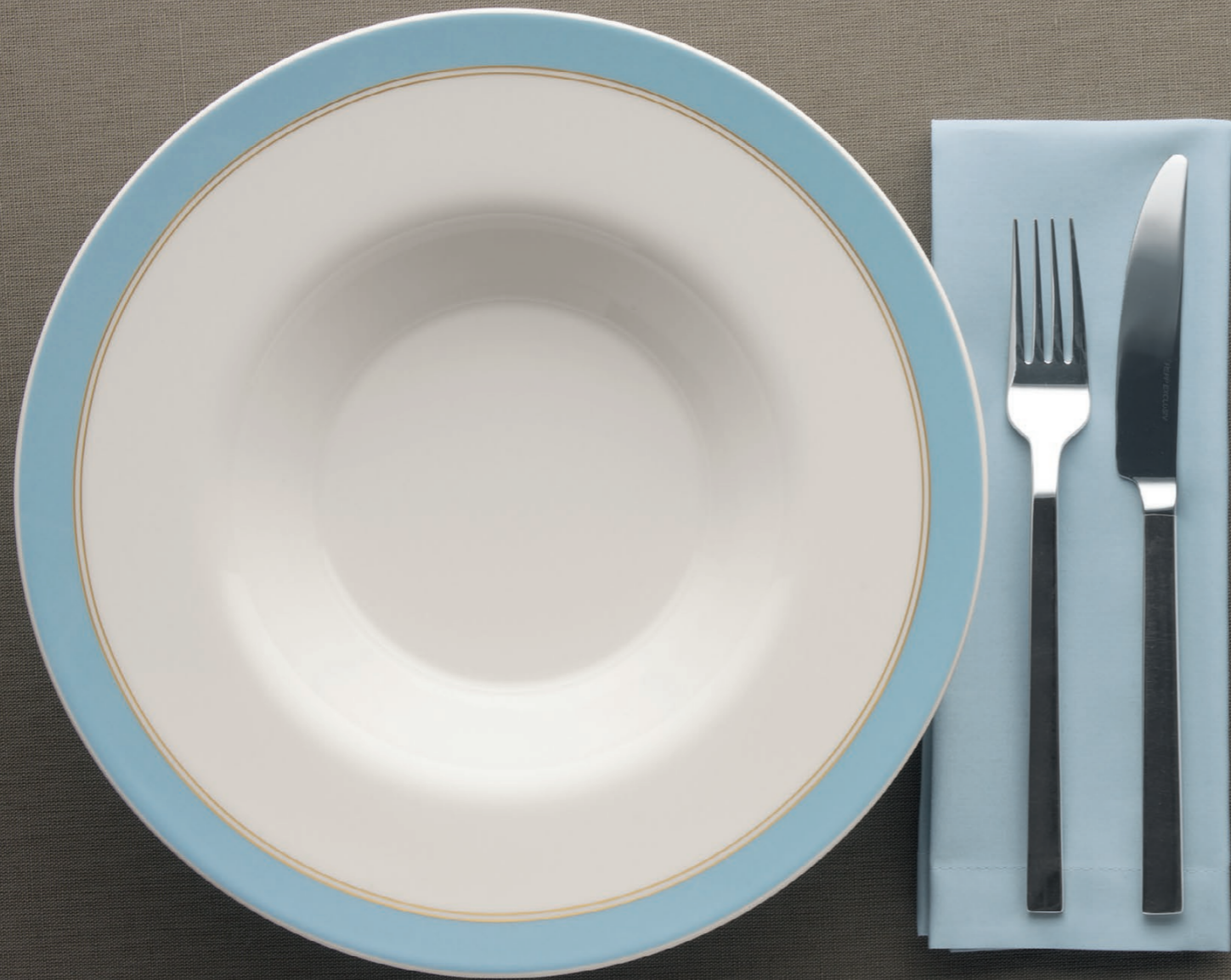
425125 Noblesse Sky