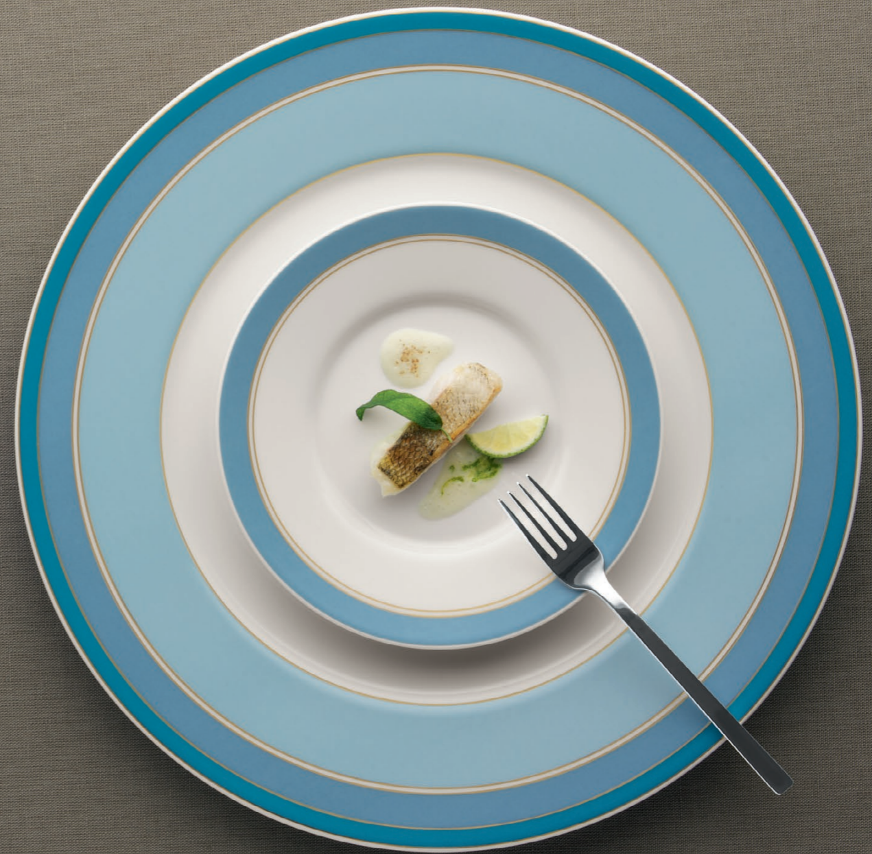
425253 Noblesse Moonstone 425249 Noblesse Lake (Platzteller/Showplate)