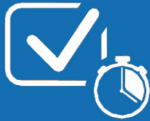
Gestor de seguimientos

Si usted desea tener más opciones de gestión. Sus características transforman las acciones pasivas y la observación del director de proyecto en un papel activo para la ejecución.