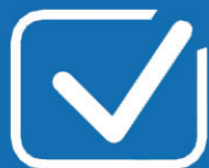
Gestor de aprobación

Una herramienta transparente para aprobar y reservar la edición, es esencial para proyectos exitosos. Cada cambio está claramente documentado. Los que controlan y gestionan las reservas, la limpieza de los elementos y gastos, nunca había sido más fácil y clara.