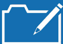
Editor de plantillas

Normalmente, la creación de nuevas estructuras de documentos es un proceso que lleva tiempo. El Editor de plantillas de proyecto hará que estos procesos le sean más fáciles, usted será capaz de crear cualquier tipo de plantilla para estructuras de Gantt.