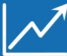
Gestor de control

Optimizar fácilmente el control de su proyecto. Con visualizaciones sencillas y precisas de sus procesos administrativos, incluso los proyectos inestructurales son más fáciles de entender, ofreciendo ideas sobre las capacidades previamente invisibles.