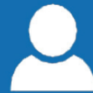
Asistente de ventas

Con esta aplicación, es fácil configurar las Oportunidades y Cotizaciones a la estructura completa del proyecto, mientras el proyecto aumenta su alcance o disminuye. Puede asignar los recursos necesarios o buscar al elemento indicado por las habilidades que posee. Esto garantiza la planificación precisa de los recursos y la exacta creación de la estructura del proyecto. El Asistente de Ventas proRM es el puente perfecto entre el proceso de ventas, el proyecto y la gestión de recursos.