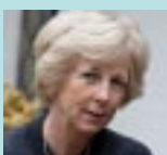
Professor Emeritus i nevrologi ved London University.

Hun gikk av med pensjon i 2010, men arbeider fortsatt én dag i uken ved National Hospital, der hun behandler pasienter og leder forsknings-