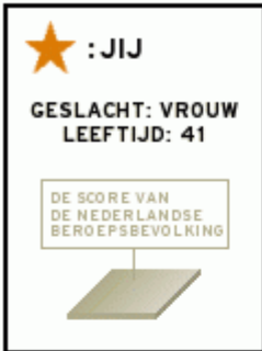
Fig. 1 COMPETENTIESCORES