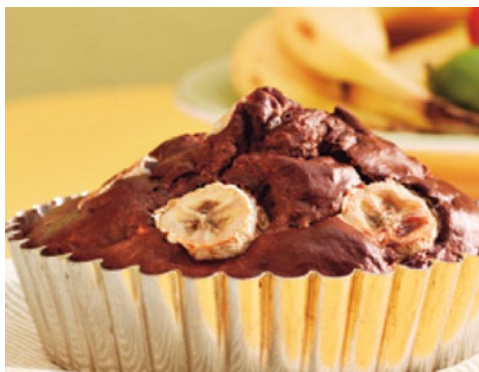
© La amarga dulzura del chocolate, Ed. Intermón Oxfam