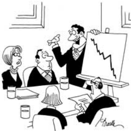
"On the brighter side, our company bowling team is in first place."