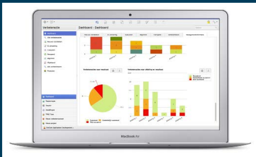
Dashboard, Improvement Manager

Via persoonlijke managementdashboards heeft u real-time overzicht van de verbeteracties, hun status, doorlooptijden en resultaten. Door middel van vooraf ingestelde templates creëert u met één druk op de knop de gewenste maand-, kwartaal- of jaarrapportages.