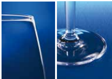
Example of chipping on the rim or foot, as a result of normal usage, which is covered under the details of the guarantee.