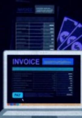
Por cada factura digital, las empresas ahorran entre 3.000 y 8.000 pesos colombianos, más IVA

por analogía a otros sectores al que podemos señalar que por cada factura enviada se ahorran entre 5.000 y 8.000 pesos colombianos, mientras que por las facturas emitidas se ahorran entre 4.000 y 15.000 pesos colombianos. Además, el verdadero valor de