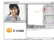
V-CUBE セールス&サポート