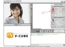
V-CUBE セールス&サポート