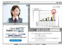
nice to meet youセールス&サポート