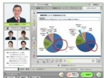
nice to meet youセミナー