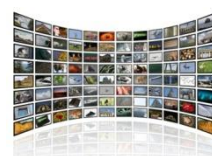
nice to meet youビデオ