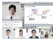
nice to meet youミーティング

最近では、世界的不況から、移動交通費などの経費削減が企業の重要課題となり、またパンデミック現象の中、直接会わずに遠隔会議ができるという点が注目され、市場拡大とともに、当社サービスの利用も順調に伸びています。