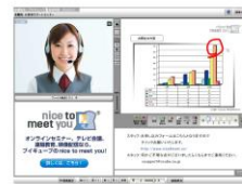
V-CUBE セールス & サポート