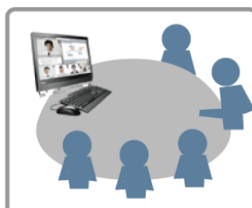
会議室の据え置き PC に