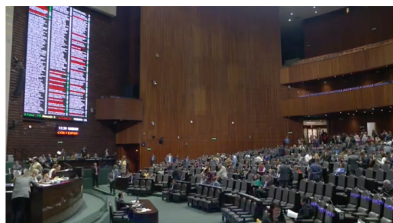
Foto: Cámara de Diputados en aprobación LIGIE

Como 2 objetivos principales, además de la adopción de la Sexta Enmienda, incluye el resultado del trabajo realizado en cuanto a la actualidad de la TIGIE en lo referente a la revisión del nivel de participación de las fracciones en las estadísticas de comercio de nuestro país, es decir, el nivel comercial de las mercancías clasificables en dichas fracciones, respecto de las cuales, el bajo nivel de diversas fracciones las lleva a considerarse como fracciones obsoletas, además de otras consideraciones como lo es el porcentaje de fracciones gravadas.