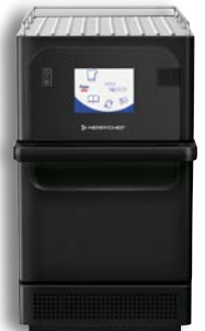
e2s Trend (schwarz)