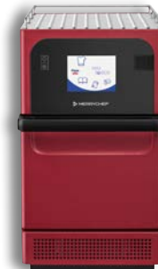
e2s Trend (rot)