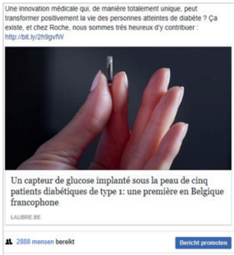
Scientific articles - most successful posts