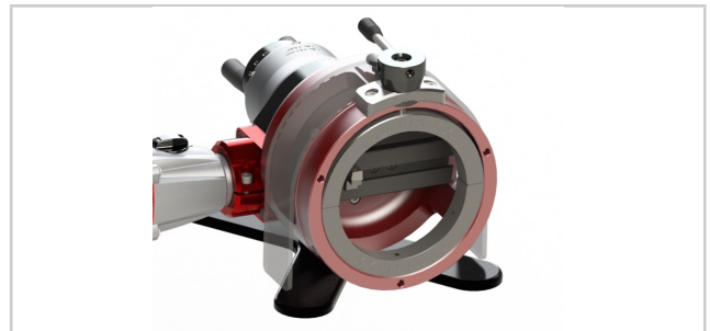
Einfaches Einspannen des Rohres.