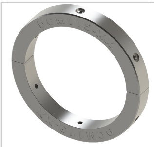
Spannzangen aus rostfreiem Stahl Ein Satz pro Durchmesser