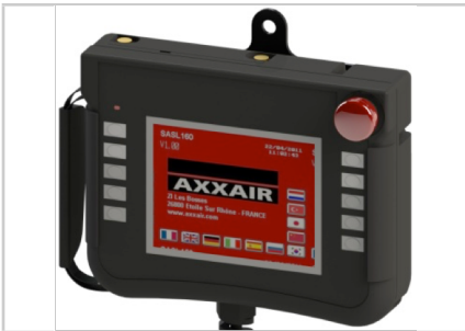
Fernsteuerung mit Farb-Touchscreen 5.7 Zoll. Gesicherter, mehrsprachiger Zugang