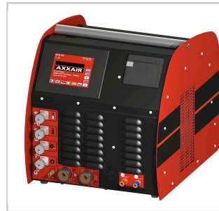
Steuerung über AXXAIR Stromquelle ( cf Kompatibilitätstabelle Stromquellen / Schweißköpfe )