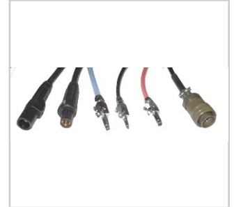
Für AMI-Generatoren geeignete Steckverbinder