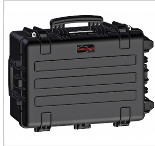
Alle Geräte werden in ihrem Transportkoffer geliefert.