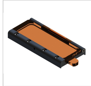
Optionales oberes Fenster zur Kontrolle der Positionierung nach dem beidseitigen Einspannen