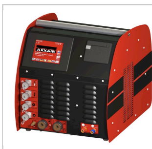
Steuerung über AXXAIR Stromquelle ( cf Kompatibilitätstabelle Stromquellen / Schweißköpfe )