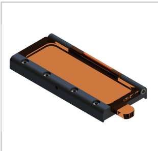
La ventana superior opcional permite controlar el posicionamiento después de sujetar con abrazaderas ambos lados.