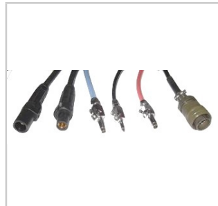
Conectores adaptados para generadores AMI.