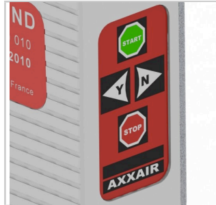
Teclado de mando desviado