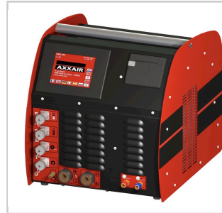
Control por equipo Seguimiento de perfil AXXAIR SASL ( CF Tabla de compatibilidad )