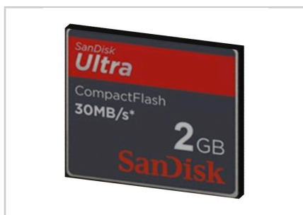
Scheda di memoria SD Flash con 200 programmi per scheda