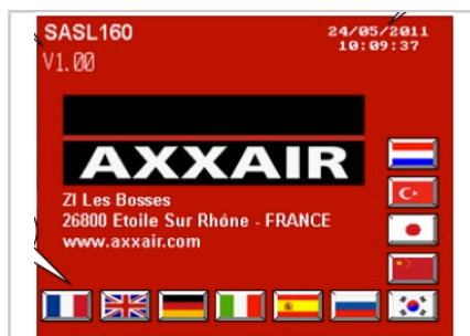
Touch screen a colori, 5,7 pollici, multilingue