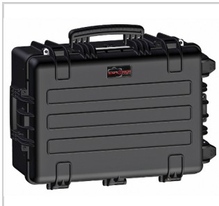
Tutte le macchine sono fornite nella propria valigetta