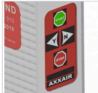
Tastierino di comando remoto