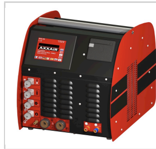
Commando de Stazione AXXAIR