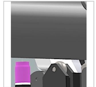
Guida profilo meccanica: tensione arco costante