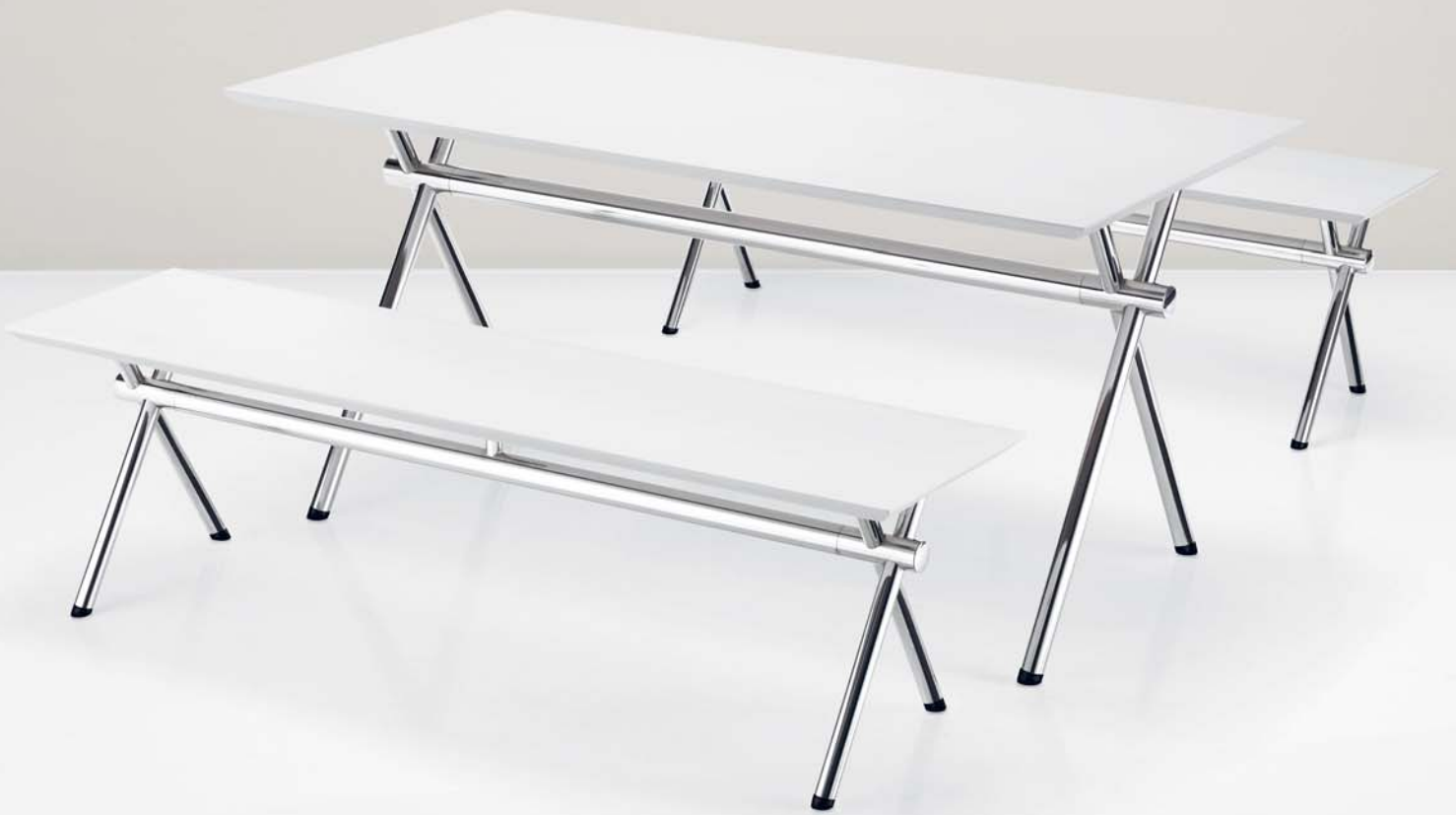
X-PÖYTÄ JA -PENKKI