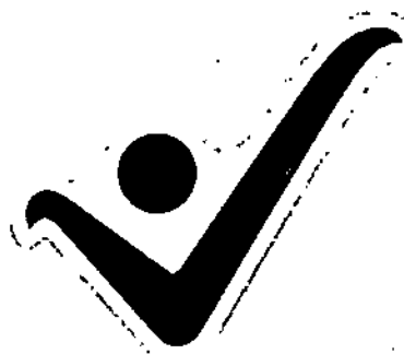
FIGURA 7. Forma del sello positivo

Parágrafo. No se puede utilizar otro tipo de forma de sello positivo, ni cambiar el color, añadir letras o frases, ni tamaños, ni ubicación.