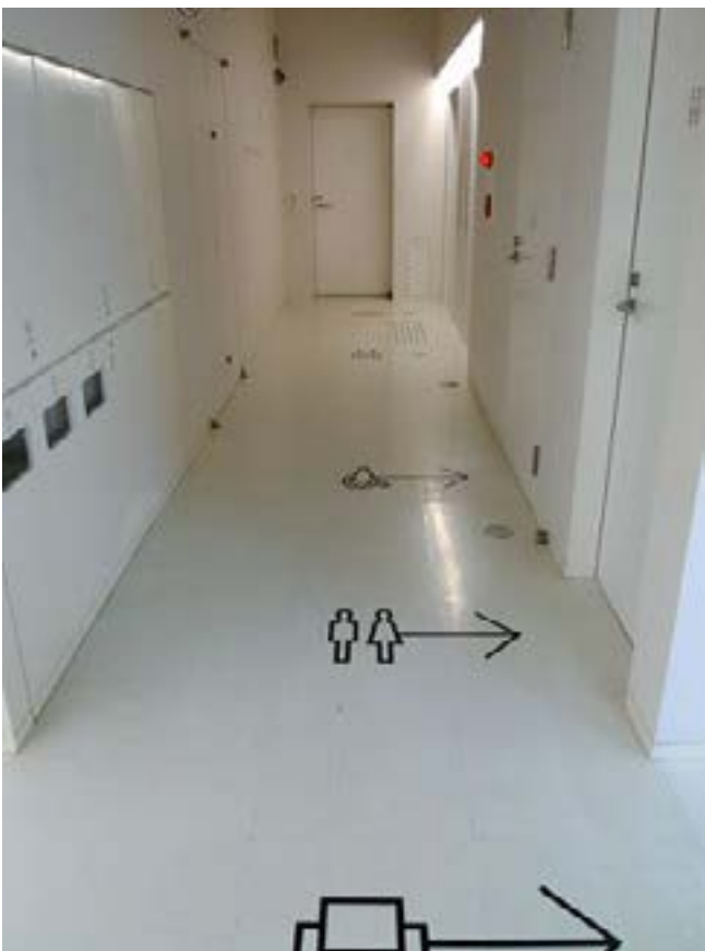
bron: Lobby van 9hours capsule hotel in Kyoto