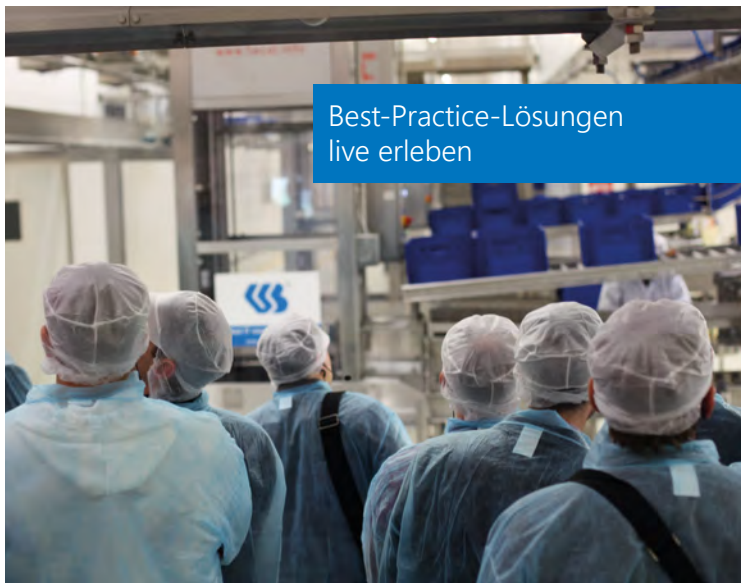
Best-Practice-Lösungen live erleben