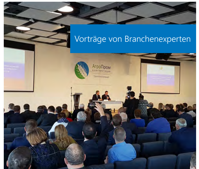
Vorträge von Branchenexperten