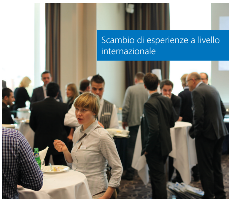
Scambio di esperienze a livello internazionale