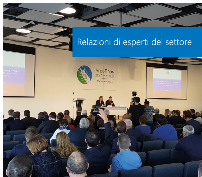
Relazioni di esperti del settore