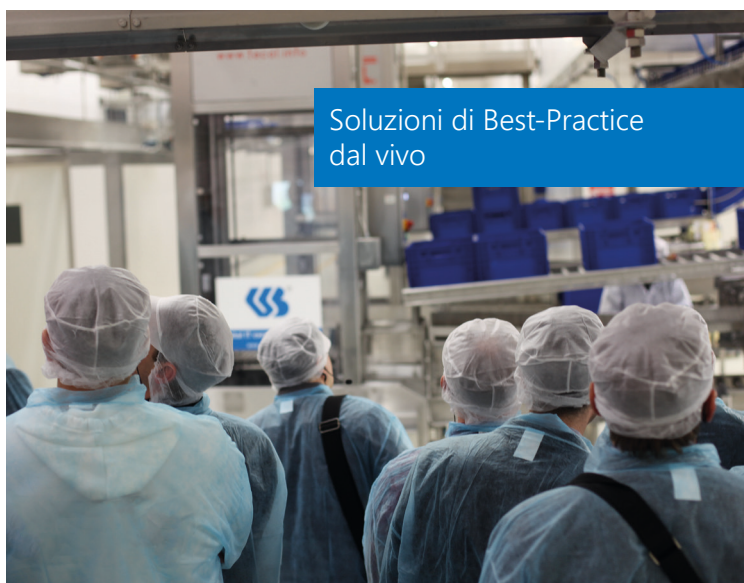
Soluzioni di Best-Practice dal vivo