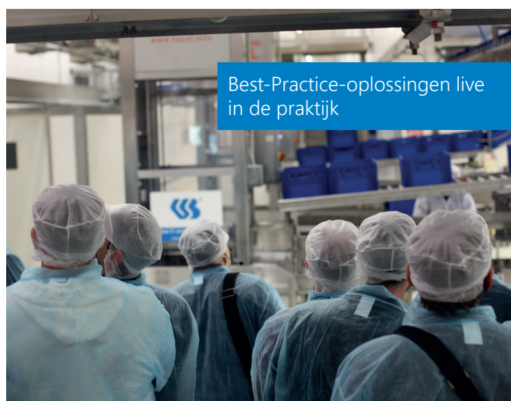
Best-Practice-oplossingen live in de praktijk