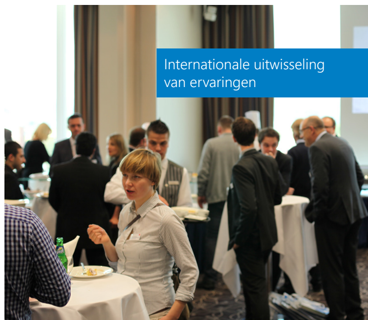
Internationale uitwisseling van ervaringen