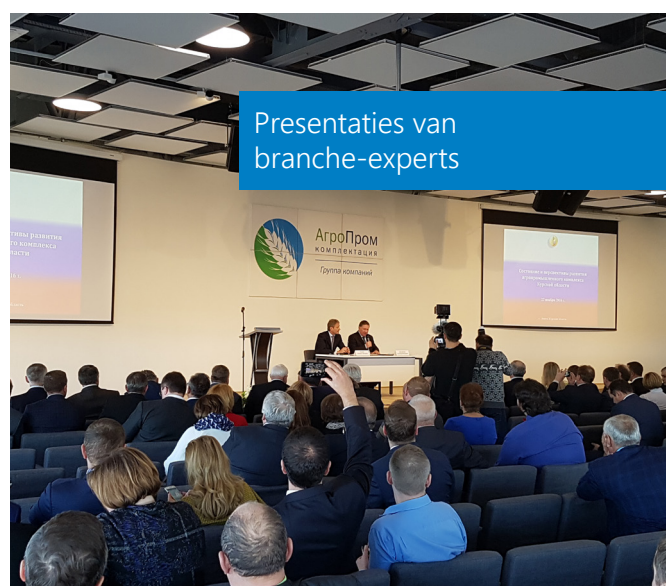
Presentaties van branche-experts