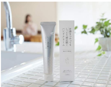
KuSu ハンドクリーム Pro 1,280 円(税込み)

手洗い頻度の高まりで手荒れが気になる方にもおすすめ すっと伸びて肌にやさしい本格日焼け止め