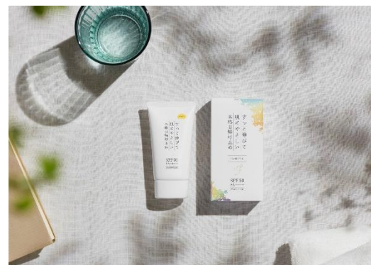
KuSu 日焼け止めクリーム Pro 2,480 円(税込み)