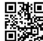
KuSu オンラインストア QRコード