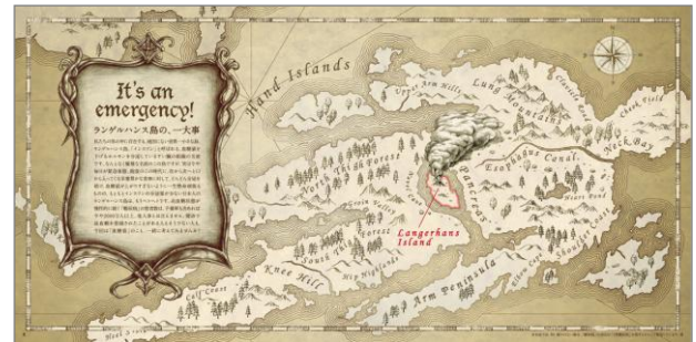
P.2-P.3 ランゲルハンス島の、一大事