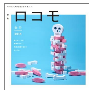
(右) ヘルス・グラフィックマガジン Vol. 29 「ロコモ号」の表紙