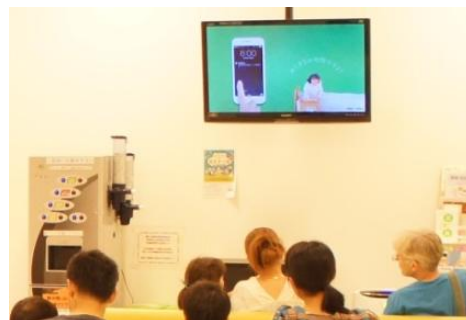
デジタルサイネージ「ヘルスケアビジョン」

情報提供を担う、もう一つの施策が「ヘルスケアビジョン」の活用です。これは、社外拠点を含む全国700拠点以上に配信される調剤薬局業界最大級のデジタルサイネージネットワークです。本キャンペーンでは、テーマに基づいて制作した動画コンテンツによる情報提供をいたします。