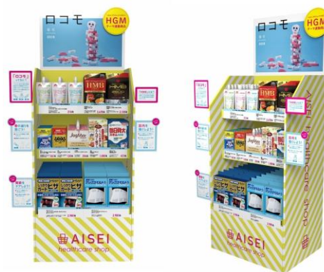
ヘルスケアショップ専用什器

「情報提供」と「商品販売」を同じテーマで同時に行えば、「必要なものをその場で入手」という利便性を訴求できます。そこで、そうした物販企画を、2017年7月より35店舗においてパイロット運用してまいりました。その結果、物販企画は来局者におおむね好評でした。それに加えて、来局者と店舗薬剤師との間のコミュニケーションが促進されることがわかりました。このことは薬局が健康サポート機能を果たすために有効な機会の創出となります。そこで、本キャンペーン開始時より、物販企画の実施店舗を全国284店舗(※2)に拡大することといたしました。(※2)2018年4月2日時点