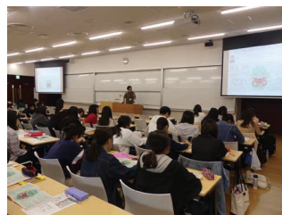
千葉経済大学短期大学部 こども学科 「健康科学概論」 講義風景

講義では、HGMの誌面に沿って、歯の役割、虫歯・歯周病のメカニズム、正しい歯磨きの方法などについて講師から丁寧な説明がありました。学生たちからは、「歯周病が、糖尿病などの全身の疾患と関連性があることなど、知らない情報が多かったです。」「HGMは、絵やグラフィックなど、見て楽しいビジュアルで歯の基本知識が興味深く解説されているため、とても分かりやすく学べました」などの感想をいただきました。学生たちが、将来、保育者となった時、HGMが次世代の子どもたちに正しい知識を伝える一助となれば幸いです。