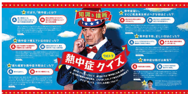
「知識を横断 ウルトラス熱中症クイズ (P.4-P.5)」

@aisei_HGM https://twitter.com/aisei_HGM