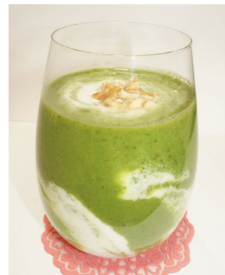
367kcal/塩分0.1g/ ビタミンA 370μg/ビタミンC 130mg

アイセイ薬局グループ各店舗では、地域の予防医療の拠点となるための取り組みの一環として、患者さまの健康相談に加えて、日々の食事に関するご相談にもお応えしています。今後も、地域の皆さまの身近な健康管理のパートナーになるべく尽力してまいります。