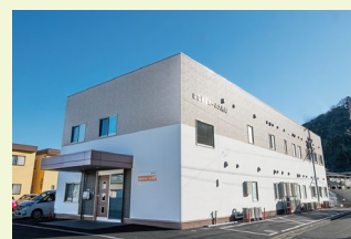
はなまるホーム大岩町

〈入居に関するお問い合わせ先: 054-200-8700(平日9:00-18:00)〉