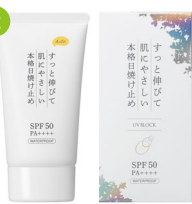
日焼け止めクリーム