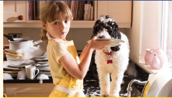
Porque los Platos se Ponen en el Lavavajillas Cuando Todo Funciona Bien

¡CRESES Insurance y Old Republic Home Protection le ofrecen una garantía para el hogar con cobertura y servicio inigualables!