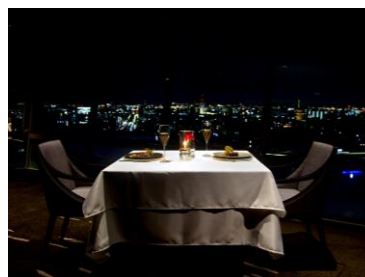
「フレンチダイニング トップ オブキョウト」店内