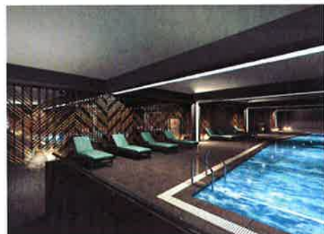
【写真上】水中にも照明を設置し、陰影を活かした癒しの空間へ 【写真下】格子をイメージし、京都らしいデザインのパラインド写真はいずれもイメージです。