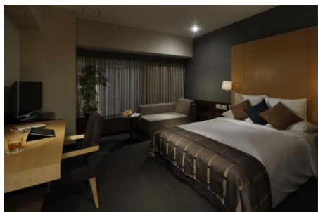
スタンダードダブル (一例)

わずか63室のために用意された最上の空間と上質の特別なおもてなしの数々。すべてに最高を求める方にこそふさわしい、リーガロイヤルホテル最上級のエグゼクティブフロアです。23階の専用フロントでは専任スタッフが24時間常駐。ご滞在中は朝食をはじめ、ティータイムやアペリティフなどお楽しみいただけるプライベートラウンジをご自由にご利用いただけます。スイミングクラブや、ご宿泊者様専用のライブラリーのご利用等、ゆったりとおくつろぎいただくためのサービスも充実しています。