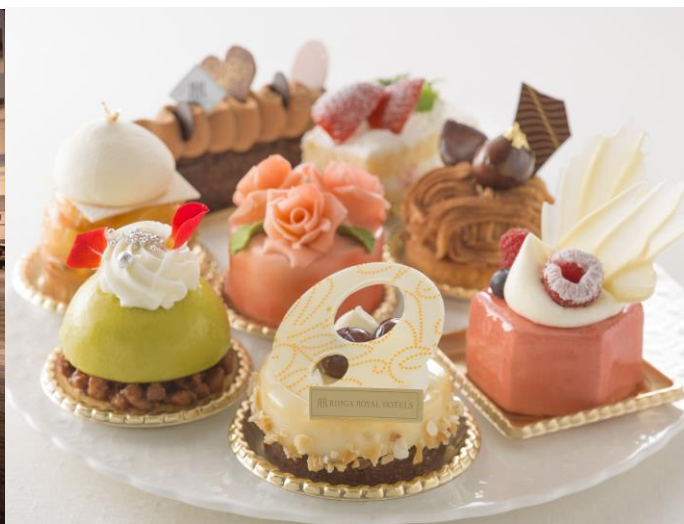
スイーツイメージ

ザ・プレジデンシャルタワーズでは、ご宿泊のお客様がご利用いただける専用ラウンジをご用意しています。