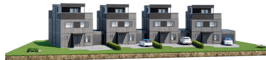
Illustrasjon av hus 80 til 86 - eneboliger i kjede på 148 kvm BRA

Dusjløsning på bad nr. 2 kan leveres som tilvalg.