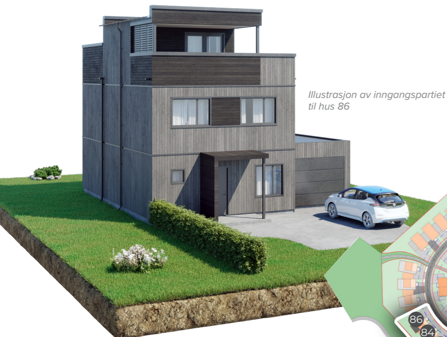
Illustrasjon av inngangspartiet til hus 86