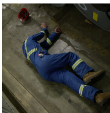
Absence de mouvement

En cas de chute, en l'absence de mouvement ou de pointage périodique, le dispositif déclenche une alarme locale en attente. Vous disposez de 30 secondes pour appuyer sur le loquet, annulant ainsi l'alarme avant qu'elle ne soit redirigée vers le personnel de surveillance en tant qu'alerte à distance.