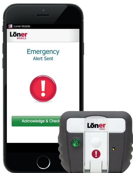
Löner Mobile e l'accessorio Bluetooth opzionale Löner Duo