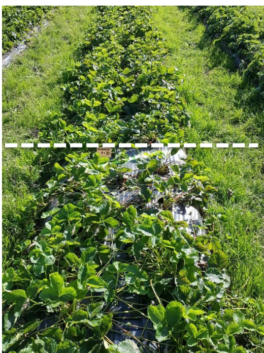
Manille (A+) edessä käsittelemättömiä, takana Prestop-upotuskäsiteltyjä.

Koe perustettiin keväällä 2017 kaupalliselle viljelmälle usealla eri mansikkalajikkeella. Frigo-taimet upotettiin nopeasti 0,5 % Prestop-vesiseokseen juuri ennen istutusta. Alla olevat kuvat on otettu noin 3 kk istutuksen jälkeen. Kokeessa kerättiin myös satotulokset, joissa keskimääräinen sadonlisä eri lajikkeilla oli 6,8 %.