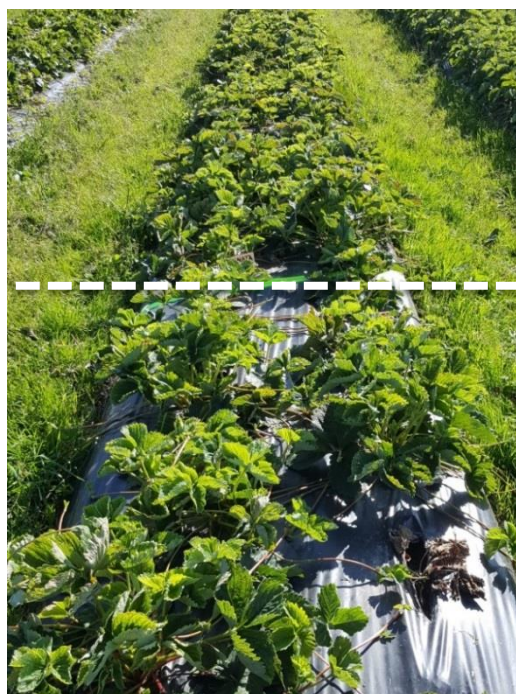
Sonata (A+) edessä käsittelemättömiä, takana Prestop-upotuskäsiteltyjä.