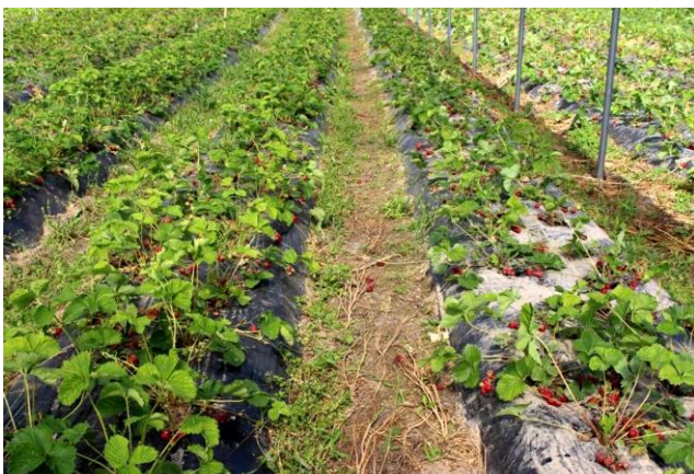
Prestop upotuskäsittely istutusvaiheessa ja kastelu 250 g/1000 kasvia noin 1 kk kuluttua istutuksesta.

Prestop on saatavilla 100 g ja 1 kg pakkauksissa. Tuote säilyy avaamattomana 12 kk viileässä, alle +8°C.