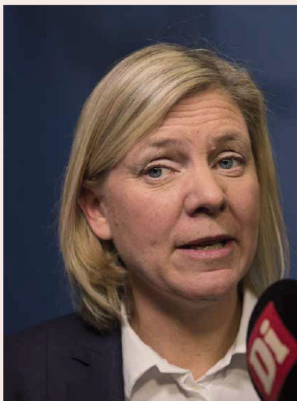
INTE AKTUELLT. Finansminister Magdalena Andersson (S) tänker inte lägga fram något skarpt förslag om höjda skatter för fastighetsbolagen i höst.